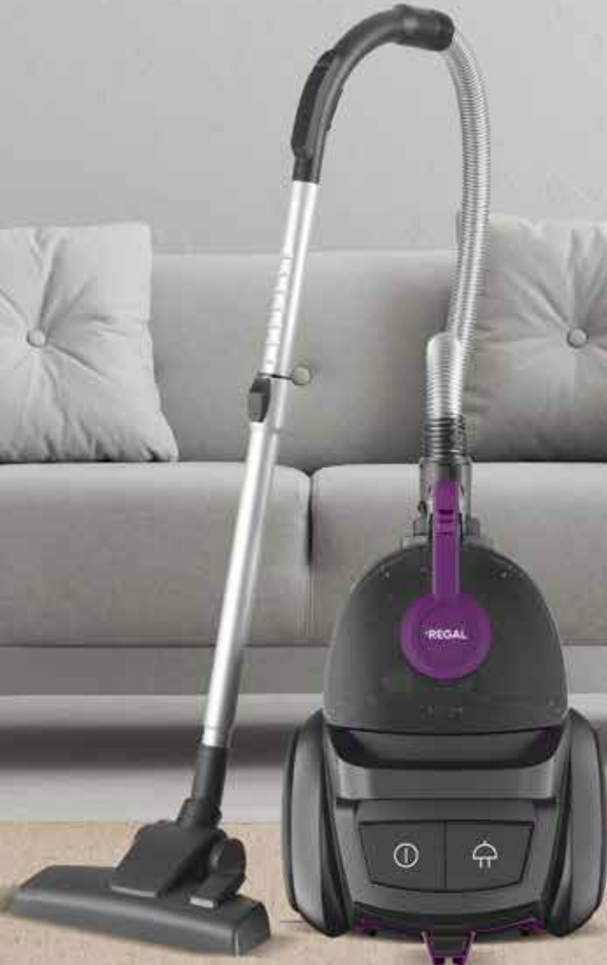
Regal RH 2000 V