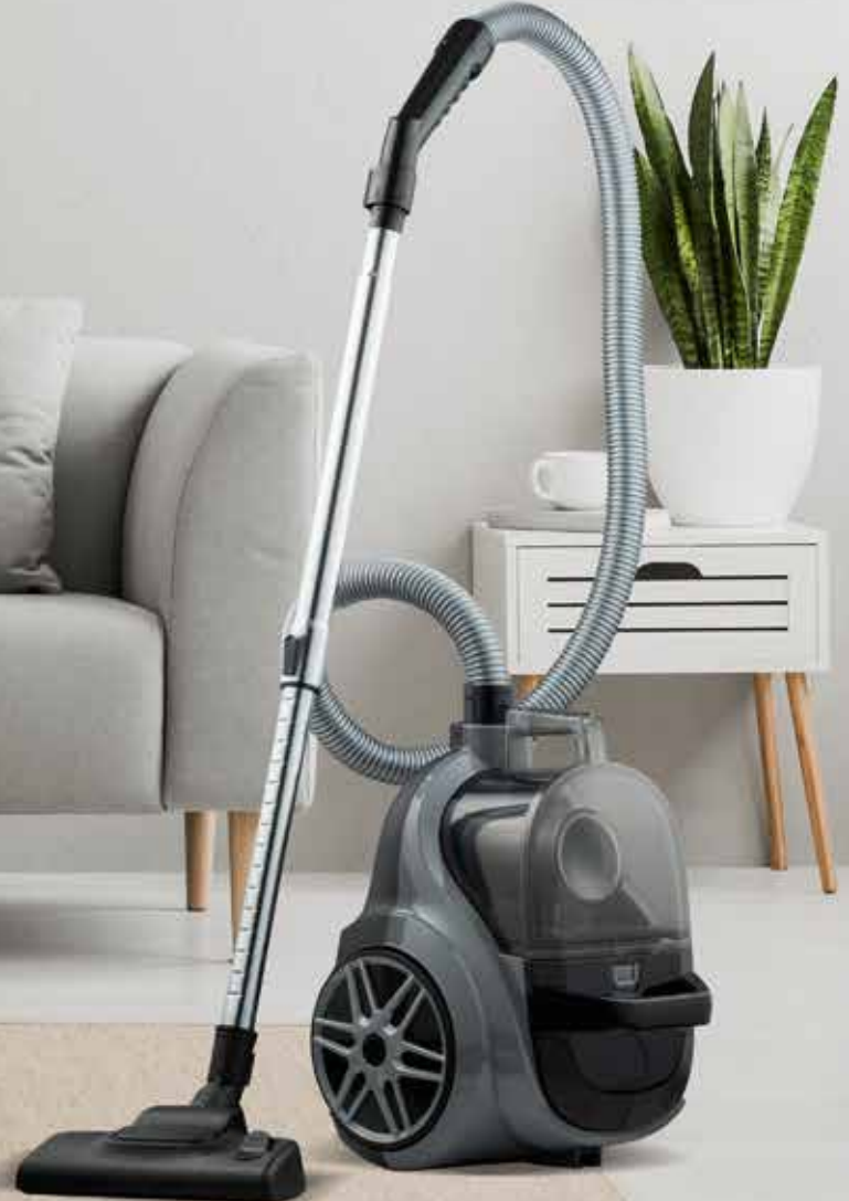
Regal RH 900 G